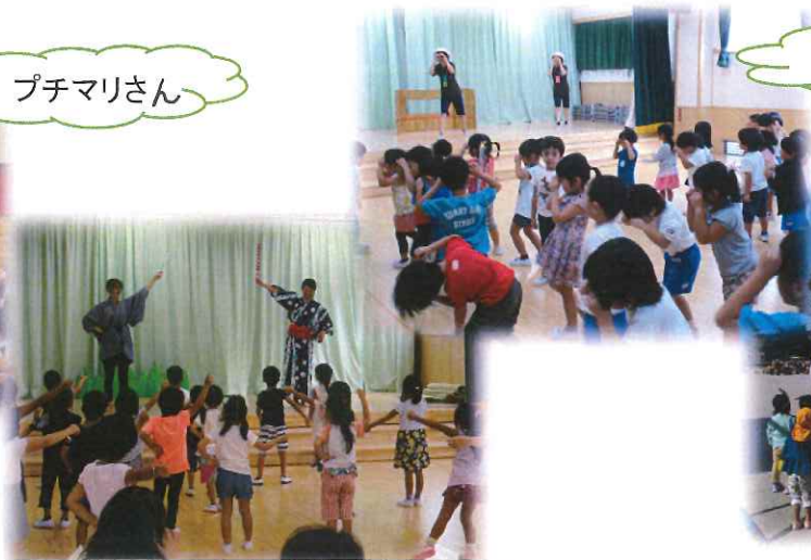
運動会の取り組み